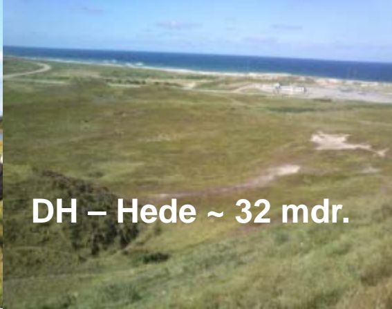
DH – Hede ~ 32 mdr.