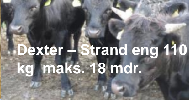
Dexter – Strand eng 110 kg maks. 18 mdr.