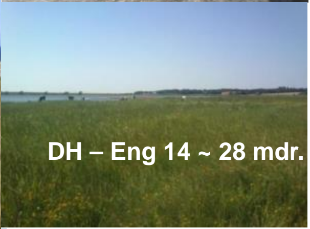
DH – Eng 14 ~ 28 mdr.