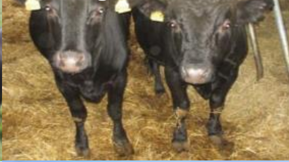
Dexter – Stald 114 kg maks. 18 mdr.