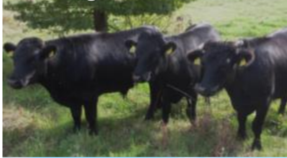
Dexter – Eng 130 kg maks. 18 mdr.