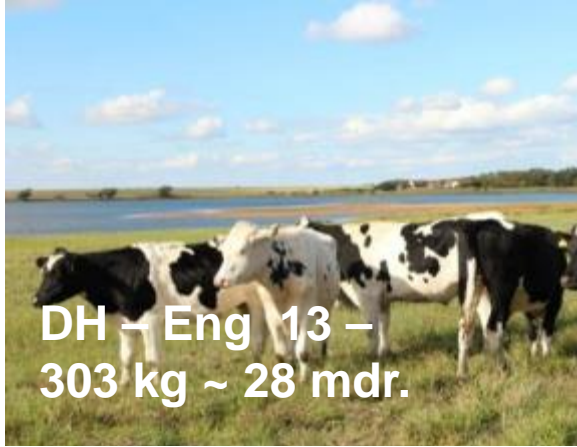
DH – Eng 13 – 303 kg ~ 28 mdr.