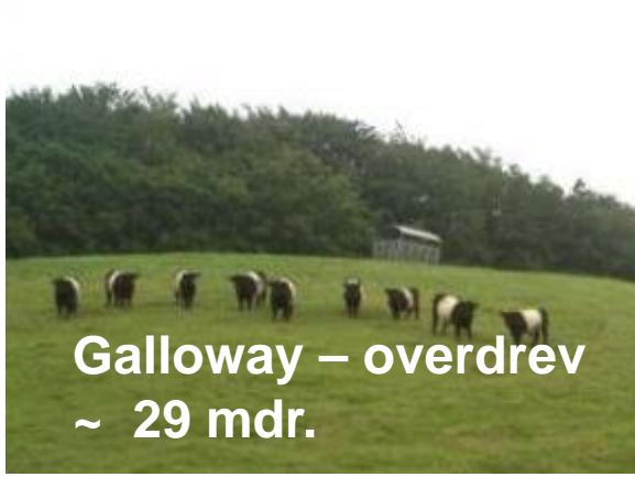
Galloway – overdrev ~ 29 mdr.